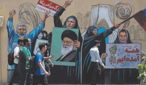
तेराना की एक सड़क के पास लगी दिवंगत सुपीम लीडर आदतुल्लाह अल खामनेई की तस्वीरों के पास से गुजरते हुए।