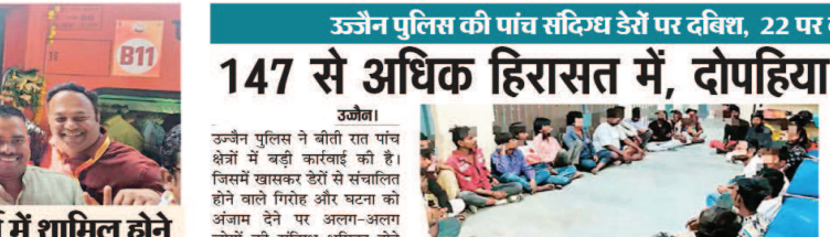
आपराधिक प्रकरण दर्ज किए जाने पर धारा 170 बीएनएसएफ के तहत प्रतिबंधात्मक कार्रवाही की गई। दबिश के दौरान संदिग्ध तत्वों में अफरा-तफरी एवं हड़कंप मच गया। कई व्यक्तियों ने मौके से भागने का प्रयास किया, जिन्हें पुलिस बल द्वारा घेरबंदी कर पकड़ा गया। साइबर सेल एवं फोरेन्सिक टीमों की संयुक्त

उज्जैन। उज्जैन पुलिस ने बीती रात पांच क्षेत्रों में बड़ी कार्रवाई की है। जिसमें खासकर डेरों से संचालित होने वाले गिरोह और घटना को अंजाम देने पर अलगा-अलगा लोगों की संदिग्ध भूमिका होने पर पकड़ा है। पांच थानों की टीम ने संयुक्त दबिश कार्यक्रमों के दौरान कुल 147 से अधिक संदिग्ध व्यक्तियों को अतिरिक्त में लेकर संबंधित थानों पर लाया गया, जहाँ उनसे वाहन पकड़ा, पहचान सत्यापन एवं पृष्ठभूमि जांच की गई।