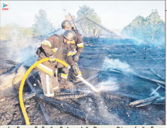
यूक्रेन की राजधानी कीव में रुसी ड्रोन हमले में क्षतिग्रस्त एक किंडर गाड़ियां में लगी आग बुझाते हुए दमकलकर्मी।

मुंबई (इंफ्रामरुका)। अमेरिकी डॉलर के मुकाबले रुपया को भारतीय रुपया 2 के गिरावट के साथ ही अपने सबसे निचले स्तर 95.70 पर बंद हुआ। आज शुक्रवाती कारोबार में रुपया अपने सर्वनिचल निचले स्तर से 16 पैसे उल्लखर 95.52 प्रति डॉलर पर पहुंच गया। आयात शुल्क बढ़ने के कारण अमेरिकी डॉलर को मांग में कमी के आसार से घबरा चुका को बल मिला है। विदेशी मुद्रा कारोबारियों का कहना है। यह मुकसान पिछले साल के 1.5 फीसदी से 2.4 फीसदी तक बढ़ गया है। हालांकि, भारत की मजबूत राजकोषीय नीति और बुनियादी ढांचे निवेश में जुड़ संघर्ष से निपटने के लिए एक मजबूत आधार प्रदान करते हैं। एक अलग सर में प्रेटेलिम और प्राकृतिक गैस मंत्री हरोपी सिंह जी ने संकेत दिया कि इंधन की कीमतें बढ़ सकती हैं, लेकिन किसी भी बढ़ोतरी का फैसला चुनावों से