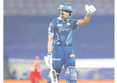
विराट के रिकार्ड की बराबरी पर आये अहमदाबाद

गुजरात टाइटंस के सलामी बल्लेबाज साई सुदर्शन ने सनराइजर्स हैदराबाद के खिलाफ हुए मुकाबले में अपनी अर्धशतकीय पारी के साथ ही एक अहम रिकार्ड भी अपने नाम कर लिया है। सुदर्शन आईपीएल सत्र में लगातार तीसरी बार 500 से अधिक रन बनाने वाले खिलाड़ी बन गये हैं। इसी के साथ ही सुदर्शन ने आईपीएल में विराट कोहली के रिकार्ड की बराबरी कर ली है।