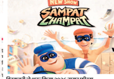
डिस्कवरी ने शुरू किया 2026 सनर फील्ड

वहीं रणनीति के बारे में कप्तान ने बताया कि यह लगातार अच्छे प्रदर्शन से संभव हुआ है। अपनी टीम को पहचान को लेकर उन्होंने कहा, हम उस तरह की टीम नहीं हैं जो किसी खास स्टाइल या ब्रांड का क्रिकेट खेलती है। हम एक ऐसी टीम बनना चाहते हैं जो खलालों का आखिलन करते हुए खेले।