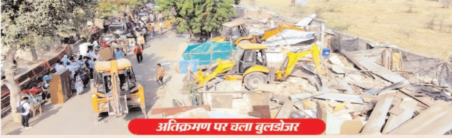
अतिक्रमण पर चला बुलडोजर

अधिकारियों के मुताबिक सड़क निर्माण का कार्य आगे इंदौर विकास प्राधिकरण द्वारा किया जाएगा। सड़क चौड़ी होने से क्षेत्र में ट्रैफिक दबाव कम होगा और आसपास के लोगों को बेहतर आवागमन सुविधा मिल सकेगी। इंदौर प्रशासन ने स्पष्ट किया है कि शहर में अवैध कब्जों के खिलाफ अभियान आगे भी लगातार जारी रहेगा। जिन स्थानों पर मास्टर प्लान के कार्य प्रस्तावित हैं, वहां चिन्हित अतिक्रमणों को हटाने की कार्रवाई चरणबद्ध तरीके से की जाएगी।