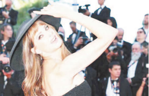
केन्स में फ्रांस की अभिनेत्री बेल रेट कार्न्य फिम समारोह के उद्घाटन समारोह में रेड कारपेट पर नजर आये।