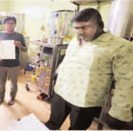
विभिन्न फूड कैटेगरी में सैमपलिंग कार्रवाई

सीएम हेल्थलाइन रिक्वायर पर प्राप्त शिकायत के आधार पर विजय श्री सैंडविच, जेल रोड का निरीक्षण किया गया। निरीक्षण के दौरान बेक समोसा का 01 नमूना जांच हेतु लिया गया।