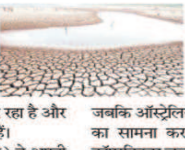
अल नीनो की स्थिति बनती है, तब इसका वैश्विक मौसम पर गहरा असर पड़ेगा। अमेरिका के दक्षिणी इलाके, दक्षिण अमेरिका महाद्वीप और हॉन ऑफ अफ्रीका में अधिक गर्मी और बारिश की संभावना है, जबकि ऑस्ट्रेलिया और इंडोनेशिया जैसे देशों को गंभीर सूखा का सामना करना पड़ सकता है।

वाशिंगटन, इंफोएस। दुनिया पर ग्लोबल वार्मिंग के बढ़ते खतरों के बीच, वैज्ञानिकों ने गंभीर चेतावनी दी है। उनका अनुमान है कि साल 2026 अब तक के सबसे गर्म वर्षों में से एक हो सकता है। यह चेतावनी तब आई है जब उत्तरी गोलार्ध गर्मी के मौसम में प्रवेश कर रहा है और संभावित अल नीनो की स्थिति तैयार हो रही है।