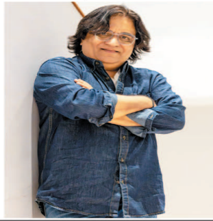
14 साल बाद शेखर सुमन की वापसी

अपने भावुक गीतों और दिल को छू लेने वाली धुनों के लिए मशहूर स्वानंद किरकिरे एक बार फिर अपने सबसे परदेवीद किंगडम सिंसेर यानी रोमांटिक म्यूजिक में लौट रहे हैं। मशहूर गीतकार और संगीतकार आले लखीने अपना नया लव सोन्ग 'अकेला' रिलीज करने जा रहे हैं। इसके साथ ही वह एक नई म्यूजिकल जर्नी की शुरुआत करेंगे, जिसमें वह हर महिने अपने यूट्यूब चैनल पर एक ऑरिजिनल गाना रिलीज करने का प्लान बना रहे हैं। नेशनल अकाॅडमी किनोटा स्वानंद इस साल पहले ही दो किंगडम रिलीज कर चुके हैं। स्वानंद का रोमांस से हरेखा खास रिश्ता रहा है। इन नए कदम के जरिए वह प्यार, कविता, सनीत और भावनाओं को और ज्यादा निजी और करीब से दर्शकों तक पहुंचाना चाहते हैं।