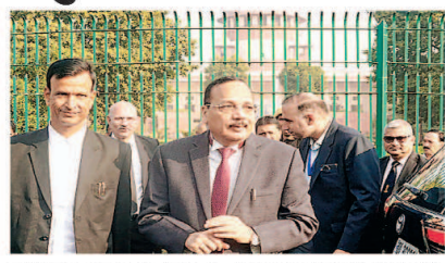
जॉयमल्य बागची की बेंच एक वकील को सीनियर एडवोकेट का दर्जा पाने की कोशिश करने के लिए कड़ी फटकार लगा रही थी। बेंच ने नाराजगी जताते हुए कहा

नई दिल्ली (एजेंसी)। कुछ बेरोजगार युवाओं की तुलना कॉकरोच से करते हुए, भारत के मुख्य न्यायाधीश (CJI) सुर्यकांत ने शुक्रवार को कहा कि वे आगे चलकर मीडिया, सोशल मीडिया और आरटीआई एक्टिविस्ट बन जाते हैं और फिर सिस्टम पर हमला करना शुरू कर देते हैं।