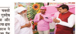
मुख्यमंत्री डॉ. यादव ने कहा कि महाराज जी का आशीर्वाद फिर काल तक हम सभी को मिलता रहे और आरंभ के साथ सीधे का यापन कर संनातन धर्म में मान्यता की कि 84 लाख योनिवर्ण के बाद हमें यह मानव जीवन मिलता है। इस मानव जीवन को सही तरीके से जीना है उससे जो जीवन सरल और संयमित होकर जैतन का मार्ग मिल जाता है। मुख्यमंत्री डॉ. मोहन यादव ने कहा कि महाराज जी की कृपा से हमने प्रदेश में गौशालाओं को बनाने और संरक्षण देने का काम कर रहे हैं। उज्जैन सहित अन्य धार्मिक नगरों में भी शराव बंदी के लागू की हैं और प्रदेश में उज्जैन, जंक्शन औरकरीर, महेश्वर दरिया, सोनबारा पीप, सतकामपुर, ओरछा, चित्रकूट स्थित 19 नगरों में शरावबंदी का आदेश आपकी कृपा से ही हो पाया है। प्रदेश में आपके बताए अनुशासन से ही कार्य हो रहे हैं।

उज्जैन। मुख्यमंत्री डॉ. मोहन यादव ने उज्जैन मकसी रोड स्थित जय गुरुदेव आश्रम में गुरुदेव महाराज से भेंट कर आशीर्वाद लिया और गुरुदेव का अमृत प्रवचन का श्रवण किया इस अवसर पर मुख्यमंत्री का श्रवण किया इस अवसर पर मुख्यमंत्री को आशीर्वाद देते हुए कहा कि आप कई वर्षों से लगातार आश्रम में आते रहे हैं। मुख्यमंत्री बनने के बाद व्यस्त समय में आप भक्ति प्रेम से आश्रम आते हैं। पहले से आपको मैं मोहन प्यारे कहकर बुलाता रहा हूँ। आज आप अपने कार्यों से जनात के थके थक गए हैं। सदा ऐसे ही समाज को सेवा में लगे रहे और सत्य, सनातन, अहिंसा के मार्ग पर चलते हुए जन सेवा करते रहें।