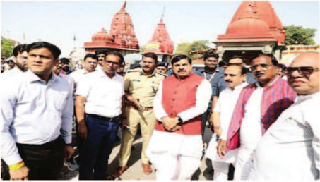
का समर्थन कर रहे हैं। उज्जैन के नागरिक चौड़ीकरण और सभी कार्यों में सहयोग प्रदान कर देश के लिए एक नई मिसाल बन रहे हैं। मुख्यमंत्री डॉ. यादव ने

उज्जैन। मुख्यमंत्री डॉ. मोहन यादव ने उज्जैन प्रवास के दौरान राम घाट पहुंचकर हरसिद्धि पाल से राम घाट मार्ग चौड़ीकरण कार्य का निरीक्षण किया। मुख्यमंत्री डॉ. यादव ने निरीक्षण कर निदेश दिए कि श्रद्धालुओं की सुविधा के दृष्टिगत कार्य तेजी से और गुणवत्ता से करें। मुख्यमंत्री डॉ. यादव ने कहा कि सिंहरथ 2028 के लिए श्रद्धालुओं और स्थानीय नागरिकों की सुविधा बढ़ाने के लिए चौड़ीकरण कार्य किए जा रहे हैं। सरकार द्वारा सभी कार्यों की सतत मॉनिटरिंग की जा रही है। सभी कार्य इस तरीके से किए जा रहे हैं कि पौराणिक और धार्मिक नगरी उज्जैन को लंबे समय तक लाभ प्राप्त हो।