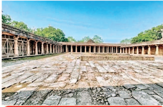
सुनवाई के दौरान किसने क्या तर्क दिए

केंद्र सरकार और ASI यह फैसला ले कि भोजशाला मंदिर का मैनेजमेंट कैसा रहेगा। 1958 एक्ट के तहत इस प्रॉपर्टी का पूरा मैनेजमेंट ASI के हथ में होगा। अदालत ने ASI का 2003 का वह आदेश भी रद्द कर दिया, जिसमें ASI ने भोजशाला में हिंदुओं को पूजा का अधिकार नहीं दिया था। उस आदेश को भी खारिज कर दिया, जिसमें मुस्लिमों को नामाज पढ़ने का अधिकार दिया गया था। भोजशाला को कमाल मौला मस्जिद बताते रहे मुस्लिम पक्ष को कोर्ट ने सरकार से मस्जिद के लिए अलग जमीन मांगने को कहा है।