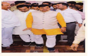
मुख्यमंत्री डॉ. यादव ने कहा कि महाराज जी का आशीर्वाद फिर काल तक हम सभी को मिलता रहे और आरंभ के साथ सीधे का यापन कर संनातन धर्म में मान्यता की कि 84 लाख योनिवर्ण के बाद हमें यह मानव जीवन मिलता है। इस मानव जीवन को सही तरीके से जीना है उससे जो जीवन सरल और संयमित होकर जैतन का मार्ग मिल जाता है। मुख्यमंत्री डॉ. मोहन यादव ने कहा कि महाराज जी की कृपा से हमने प्रदेश में गौशालाओं को बनाने और संरक्षण देने का काम कर रहे हैं। उज्जैन सहित अन्य धार्मिक नगरों में भी शराव बंदी के लागू की हैं और प्रदेश में उज्जैन, जंक्शन औरकरीर, महेश्वर दरिया, सोनबारा पीप, सतकामपुर, ओरछा, चित्रकूट स्थित 19 नगरों में शरावबंदी का आदेश आपकी कृपा से ही हो पाया है। प्रदेश में आपके बताए अनुशासन से ही कार्य हो रहे हैं।

मुख्यमंत्री डॉ. मोहन यादव ने टोकफला स्थित पटाखा फेक्ट्री में हुए विस्फोट की घटना का त्वरित सज्ञान लिया है। मुख्यमंत्री डॉ. मोहन यादव ने अमलतास अस्पताल पहुंचकर घुटने में घायल हुए श्रमिकों का हाल जाना। उन्होंने सभी घायलों के स्वास्थ्य की स्थिति की विस्तृत जानकारी ली। मुख्यमंत्री डॉ. मोहन यादव ने अस्पताल प्रबंधन को घुटने में घायलों के समुचित उपचार के निर्देश दिए। उन्होंने कहा कि उपचार में किसी भी प्रकार की कोताही बर्दाश नहीं की जाएगी। उन्होंने घायलों को आश्वासन दिया कि संकट की इस घड़ी में प्रदेश सरकार आपके साथ है, प्रत्येक पीड़ित को हर संभव मदद उपलब्ध कराई जाएगी। इस हृदय विदारक घटना में जिन श्रमिकों की अस्मात्क मृत्यु हुई है, मुख्यमंत्री डॉ. मोहन यादव ने उनके प्रति अपनी गहरी संवेदनाएं व्यक्त की। राज्य सरकार की ओर से प्रत्येक मृतक के शोककाल परिवार को 4-4 लाख रुपये की आर्थिक सहायता दी जाएगी। टोकफला स्थित पटाखा फेक्ट्री में सुरक्षा मानकों की अदेखी या किसी भी तरह के अंध श्रमालोक की महलता से प्रभावित की जाएगी। इसके लिए उन्होंने घटना की जांच के आदेश भी दिए हैं। जांच रिपोर्ट के आधार पर जो भी दोषी पाया जाएगा, उसके विरुद्ध कठोर कानूनी कार्रवाई की जाएगी।