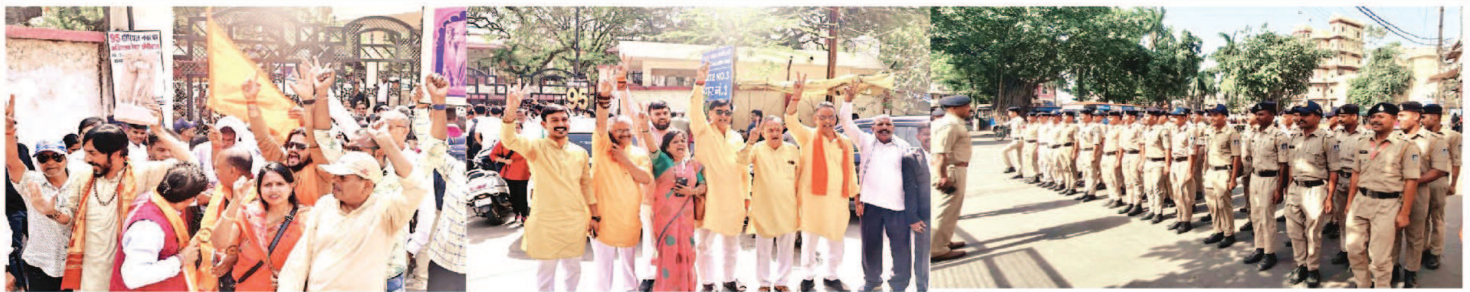
इंदौर। शुक्रवार को धारमोजशाला को लेकर हाईकोर्ट में हिंदू पक्ष के पक्ष में फैसला आने के बाद हाईकोर्ट के बाहर सूशी मजाते हुए लोग। वहीं हाईकोर्ट के निर्णय आने के पहले राजवाड़ा पर भारी पुलिस बल तैनात रहा।