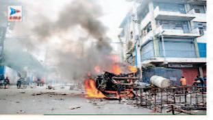
10 आम नागरिक भी शामिल हैं, जिनमें

पोर्ट-ओ-प्रिंस (एजेंसी)। हैती की राजधानी पोर्ट-ओ-प्रिंस एक बार फिर भीषण हिंसा और गैंगवार की चपेट में है। शहर के बाहरी इलाकों, विशेष रूप से सिटी सोलिय और क्रोआ-दे-बुक में पिछले कुछ दिनों से जारी खूनी संघर्ष ने भयावर रूप ले लिया है। इस तांडव में अब तक कम से कम 78 लोगों की जान जा चुकी है, जबकि 66 से अधिक लोग गंभीर रूप से घायल हैं। संयुक्त राष्ट्र की रिपोर्ट के अनुसार, मृतकों में