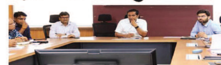
शेप दिनों का भी हर निर्माण कार्य को स्टाइड में बर्पन रहता है। जिससे कार्य की पूर्णता की तारीख भी दिखाई देती है और काम की वास्तविक गति भी परिलक्षित होती है। बैठक में काठ डायवर्सन परियोजना के संबंध में जानकारी दी गई कि कार्य तेज गति से किया जा रहा है। पिछले एक सप्ताह के दौरान 340 मीटर भूमिगत लाइन खलने का कार्य पूर्ण किया गया है। वहीं टनल में 8.6 किलोमीटर तक का कार्य प्रगतिरत है। संभागायुक्त सिंह ने काठ डायवर्सन परियोजना के तहत कार्य की गति और बढ़ाने के निर्देश दिए हैं।

उज्जैन। संभागायुक्त सह सिंहरथ मेला अधिकारी आशीष सिंह ने शुक्रवार को सिंहरथ 2028 के लिए विभिन्न विभागों के माध्यम से प्रचलित निर्माण कार्यों की समीक्षा बैठक की। इस दौरान विभागों के माध्यम से कार्य प्रगति की जानकारी दी गई। संभागायुक्त सिंह ने निर्देश दिए कि सिंहरथ के तहत निर्माणधीन मार्ग चौड़ीकरण कार्य, ब्रिज निर्माण कार्य, सड़क निर्माण कार्य की सतत मॉनिटरिंग करते हुए तेज गति से निर्माण कार्य किए जाएं। जिससे बारिश का मौसम शुरू होने के बाद निर्माण कार्य के दौरान परेशानी न हो।