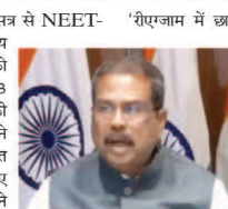
बाबजूद यह उल्लंघन कैसे हुआ। ऐसे में सरकारी मशीनरी यह सुनिश्चित करेगी कि इस बार कोई अनियमितता न हो।

नई दिल्ली (एजेंसी)। अगले सत्र से NEET-UG परीक्षा ऑनलाइन होगी। केंद्रीय शिक्षा मंत्री धर्मंद प्रधान ने शुक्रवार को इसका ऐलान किया। उन्होंने माना कि 3 मई को हुई हृदयभङ्ग-च-2026 की परीक्षा के पेपर लीक हुए थे। उन्होंने कहा, 'हम नहीं चाहते थे कि कोई गलत कैडिडेट सिलेक्ट हो जाए। इसलिए हमने बड़ी जिम्मेदारी से परीक्षा रद्द करने का फैसला लिया। अब यह परीक्षा रविवार 21 जून को होगी। 7 मई को गड़बड़ी का पता चला था। एनटीए ने सरकार को बताया। फिर 12 मई को रीएजाम का फैसला लिया गया।' शिक्षा मंत्री ने कहा,