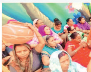
प्रत्येक नागरिक तक नगद का जल नहीं पहुंचा

जिन क्षेत्रों में नगदलाइन नहीं वहां स्थिति भयावह-कांग्रेस ने शहर के उन क्षेत्रों की स्थिति पर भी चिंता व्यक्त की है जहां अभी तक नगद लाईन का पंपलाइन नहीं बिछाई जा सकी है। इन इलाकों में रहने वाले लोग