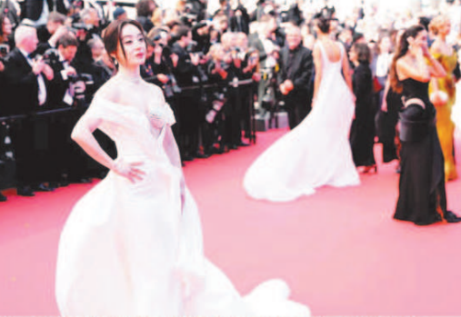
फ्रांस के कांस में जारी 79 के अंतरराष्ट्रीय फिल्म समारोह में फिल्म फोरलैंड के प्रीमियर में पोज देती हुई अंशराजनसन।