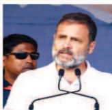
चुकाएगी। राहुल गांधी ने भविष्य में भी तेल कीमतों में इजाफा होने की आशंका जाहिर की है। राहुल गांधी ने

नई दिल्ली (एजेंसी)। लोकसभा में नेता प्रतिपक्ष (एलओपी) राहुल गांधी ने पेट्रोल और डीजल की कीमतों में बढ़ोतरी पर केंद्र सरकार पर बड़ा हमला बोला है।