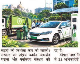
वाहनों की निर्भरता कम की जाएगी। सरकार का उद्देश्य कार्बन उत्सर्जन घटाना और पर्यावरण संरक्षण को

भोपाल। मध्यप्रदेश सरकार ने ग्रीन मोबिलिटी को बढ़ावा देने की दिशा में बड़ा कदम उठाया है। अब नगर निगम अधिकारियों की आवाजाही के लिए इलेक्ट्रिक व्हीकल का उपयोग किया जाएगा, वहीं शहरों में डोर-टू-डोर कचरा कलेक्शन भी ईवी वाहनों से कराने की तैयारी शुरू हो गई है। नगरीय प्रशासन विभाग ने इस संबंध में प्रदेश की सभी नगरीय निकायों को निर्देश जारी कर दिए हैं।