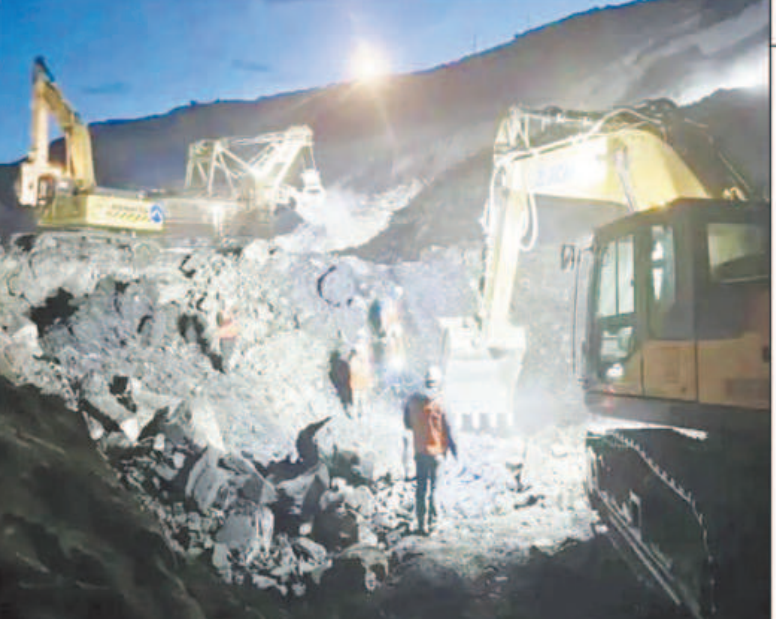
रुस के मेगादन में एक कोयला खदान में राहत और बचाव का काम करते हुए कर्मचारी। इस दौरान चार बच्चों के शव मिले हैं।

नई दिल्ली, (ईएमएस)। आम आदमी पार्टी का दामन छोड़कर हाल ही में भारतीय जनता पार्टी में शामिल हुए राज्यसभा सांसद संदीप पाठक ने अपने खिलाफ पंजाब में दर्ज हुई प्राथमिकियों (एफआईआर) को लेकर तीखी प्रतिक्रिया दी है। संदीप पाठक ने स्पष्ट किया है कि उन्हें अभी तक इन एफआईआर की कोई भी आधिकारिक प्रतियां औपचारिक सूचना प्राप्त नहीं हुई है। उन्होंने इस कार्रवाई को सरकारी तंत्र का दुरुपयोग करार देते हुए कहा कि वह एफआईआर के दस्तावेजों को देखने के बाद ही विस्तार से अपनी बात रखेंगे। दिल्ली आईआईटी के पूर्व प्रोफेसर रहे संदीप पाठक को राजनीति में कुशल रणनीतिकार माना जाता है। उन्हें 2022 के पंजाब विधानसभा चुनावों में 'आप' की ऐतिहासिक जीत का मुख्य सूत्रधार-पार्टी संगठन को मजबूत करने वाला चेहरा माना जाता था।