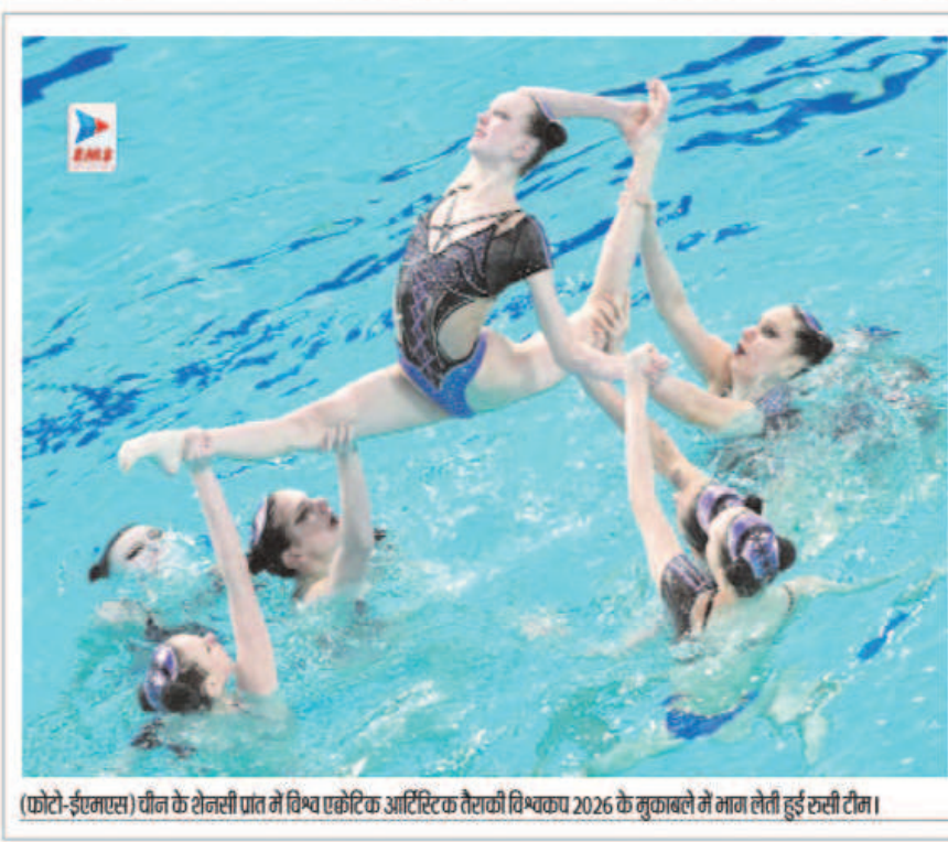
चीन के टैंगरी प्रांत में विश्व एकोरिफ आर्टिफिशियल रिफ्लेक्स 2026 के मुकाबले में भाग लेती हुई टैंगरी टीम।

हैं। पिछले कुछ सत्र में कई खिलाड़ी अपनी गर्लफ्रेंड्स के साथ यात्रा करते और होटलों में रुकते देखे गए हैं, जिससे बोर्ड नाराज है। बीसीसीआई इसलिए भी परेशान है क्योंकि कुछ खिलाड़ियों की गर्लफ्रेंड्स पर बोटिंग ऐप्स के लिए काम करने का संदेश है। यह भ्रष्टाचार रोधी नियमों के उल्लंघन के साथ ही खेल की अखंडता के लिए खतरा है। इसके अतिरिक्त, कई युवा भारतीय क्रिकेट खिलाड़ियों की गर्लफ्रेंड्स सोशल मीडिया पर इन्फ्लुएंसर हैं और अपने पेज पर विभिन्न प्रोडक्ट्स, जिनमें बोटिंग ऐप्स और शराब ब्रांड्स भी शामिल हैं, का प्रचार करती हैं।