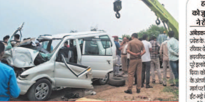
तिलक समारोह से लौट रहे एक ही परिवार के पांच लोगों की दर्दनाक मौत

नई दिल्ली/जालौन/पटना, (ईएमएस)। उत्तर प्रदेश के जालौन जनपद में सोमवार सुबह एक हृदयविदारक सड़क हादसा सामने आया है, जिसमें एक ही परिवार के छह सदस्यों की जान चली गई। कालपी कोतवाली क्षेत्र के अंतर्गत जालौन मोड़ के पास हुए इस हादसे में चार अन्य लोग गंभीर रूप से घायल हुए हैं। सभी पीड़ित ललितपुर जनपद के महरीनी निवासी थे, जो अयोध्या में रामलला के दर्शन कर वापस अपने घर लौट रहे थे। वहीं बिहार के रोहतास जिले में सोमवार की अल सुबह एक रूह कर्पा देने वाला सड़क हादसा पेश आया, जिसमें पांच लोगों की असमय मौत हो गई।