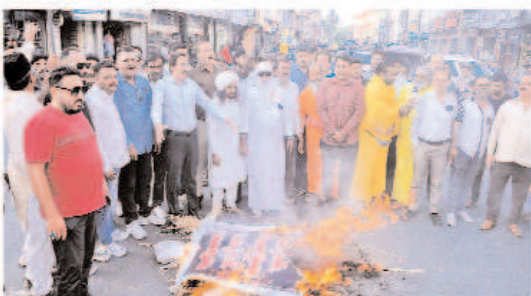
इंदौर में पहलगाम आतंकी हमले का विचार प्रदर्शन किया गया।

इंदौर। कश्मीर के पहलगाम में पर्यटकों पर हुए आतंकी हमले से पूरा देश आक्रोशित है। इंदौर में भी सर्वधर्म संघ के बनेर तले आतंकवाद का पुतला फूँका गया और पाकिस्तान मुर्दाबाद आतंकवादियों की गोलि मारी जैसे नारे लगाते हुए आतंकवाद का पुतला जलाया। लोगों ने आतंकी हमले की कड़े शब्दों में निंदा की।