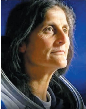
नई दिल्ली (राष्ट्रीय जनभावना)।

भारतीय मूल की अमेरिकी एस्ट्रोनाट सुनीता विलियम्स और बुच विल्मोर 9 महीने 14 दिन बाद पृथ्वी पर लौट आए हैं। इनके साथ क्रू-9 के दो और एस्ट्रोनाट अमेरिका के निक हेग और रूस के अलेक्सांद्र गोरबुनोव भी हैं। उनका ड्रैगन स्पेसक्राफ्ट भारतीय समयानुसार 19 मार्च को सुबह 3:27 बजे फ्लोरिडा के तट पर लैंड हुआ। ये चारों एस्ट्रोनाट मंगलवार (18 मार्च) को इंटरनेशनल स्पेस स्टेशन (ISS) से खाना हुए थे। स्पेसक्राफ्ट के धरती के वायुमंडल में प्रवेश करने पर इसका तापमान 1650 डिग्री सेल्सियस से ज्यादा हो गया था। इस दौरान करीब 7 मिनट के लिए