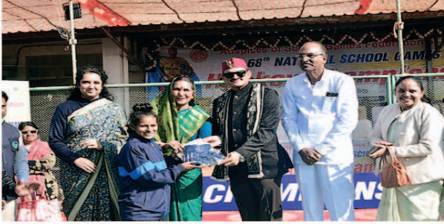
68 वीं राष्ट्रीय शालेय हॉकी क्रीड़ा प्रतियोगिता के फाइनल मुकाबले में झारखंड टीम विजेता रही