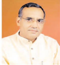
विदेश प्रवास से लौटने पर मुख्यमंत्री ने