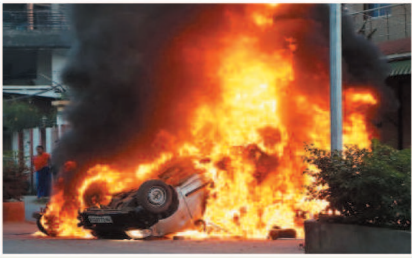
हिंसा के बीच शाह महाराष्ट्र की रैली रफ

इंफाल (एजेंसी)। मणिपुर के कई जिलों में हिंसा के चलते हालात एक बार फिर बेकाबू हो गए हैं। जिरिबाम से मैतेई परिवार के 6 सदस्यों के अपहरण और फिर तीन शव मिलने के बाद यहां हिंसा भड़क गई। इसके बाद सात जिलों में इंटरनेट सेवा बंद कर दी गई और कर्फ्यू लगा दिया गया है।