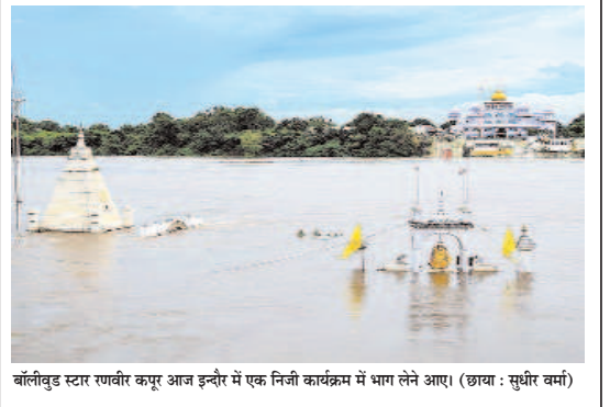
बॉलीवुड स्टार रणवीर कपूर आज इन्दौर में एक निजी कार्यक्रम में भाग लेने आए।

हमारी सरकार ने प्रदेश के कल्याण के लिए पिछले आठ माह में बड़े-बड़े फैसले लिए हैं। सांसद श्री वी.डी. शर्मा ने कहा कि कटनी के कल्याण के लिए आज का दिन ऐतिहासिक दिन है। कटनी जिले के 151 गाँव की तस्वीर और तकदीर बदलने वाली 1011.05 करोड़ की लागत की सिंचाई परियोजना का कार्य मुख्यमंत्री डॉ. यादव ने आज शुरू किया है। इस परियोजना की मांग क्षेत्र की जनता लगातार कई वर्षों से कर रही थी। उन्होंने कहा कि जल जीवन मिशन अंतर्गत भी हर घर पेयजल पहुँचाने का कार्य किया जा रहा है। परियोजना से सिंचाई के साथ पेयजल की सुविधा भी क्षेत्र के लोगों को मिलेगी। हर नागरिक को सख्त सुविधाएँ उपलब्ध करा रही है। कार्यक्रम में क्षेत्रीय विधायक श्री प्रणय प्रशांत पांडेय, श्री धीरेन्द्र बहादुर सिंह सहित जन-प्रतिनिधि और बड़ी संख्या में किसान, जनसमुदाय एवं लाडली बहनें उपस्थित रही।